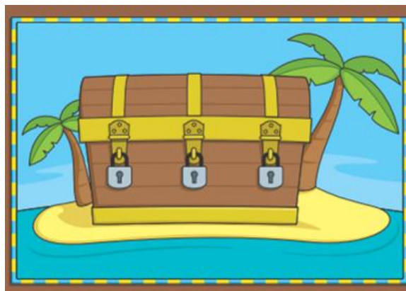
Figure n°1 : le plateau du jeu Grapho-Logic

Le jeu d’orthographe approchées que nous présentons ici est issu d’une démarche collaborative de 3 années entre enseignants-chercheurs, conseillers pédagogiques de circonscription et professeurs des écoles. Il est destiné à des élèves de grande section de maternelle. Il vise à leur permettre de découvrir la dimension phonographique de l’orthographe du français, c’est-à-dire a) découvrir qu’en français, les signes graphiques utilisés servent le plus souvent à coder des sons ; b) développer quelques connaissances liées au principe alphabétique et à la combinatoire. Ce jeu de plateau s’appelle Grapho-Logic. Les élèves doivent réaliser des tâches. Lorsqu’ils réussissent une tâche, ils ouvrent un verrou tenant un coffre fermé (voir figure 1 ci-dessous : le plateau de jeu).